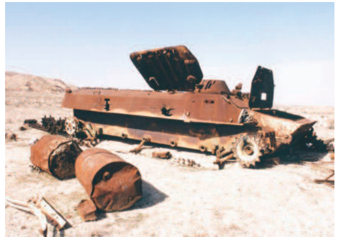
Irakese tank met VU munitie

een compensatiefonds op voor veteranen die kampen met hun gezondheid na uitzendingen.